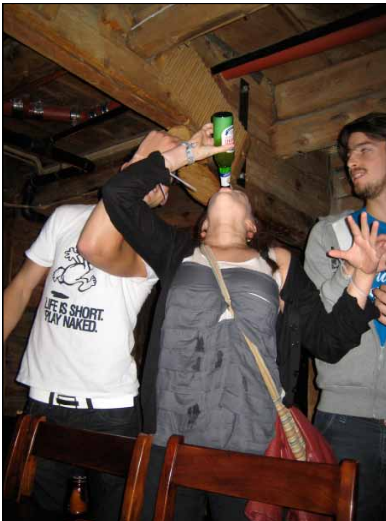
Life is short. Play naked.

Så tusen, tusen takk, bedre faddere kunne vi ikke hatt!