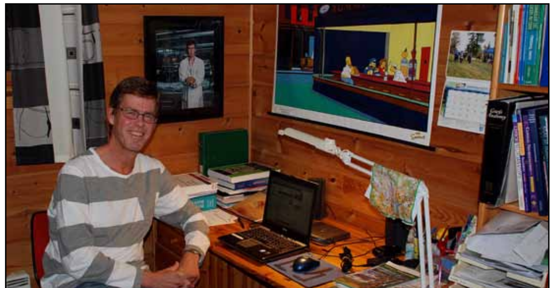
Ikke alle kan skryte av tittelen "Årets Underviser 2009"