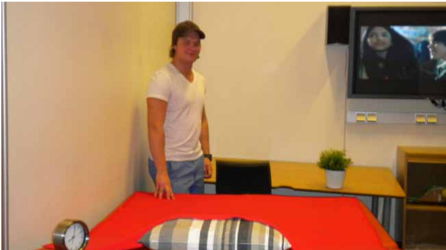
Master bedroom, dobbelseng og widescreen TV med Justin Biebers "Baby". MTV cribs neste!