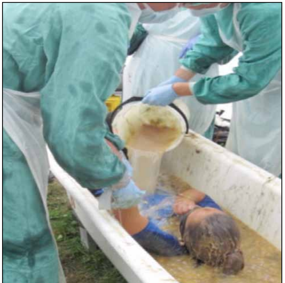
Fiskeslo - bra for huden, bra for humøret.

Immballet påfølgende torsdag skulle bli en fantastisk, men vemodig avslutning på to herlige fadderuker. Det var en helaften med glitter og stas, latter og (kor)sang, morsomme taler