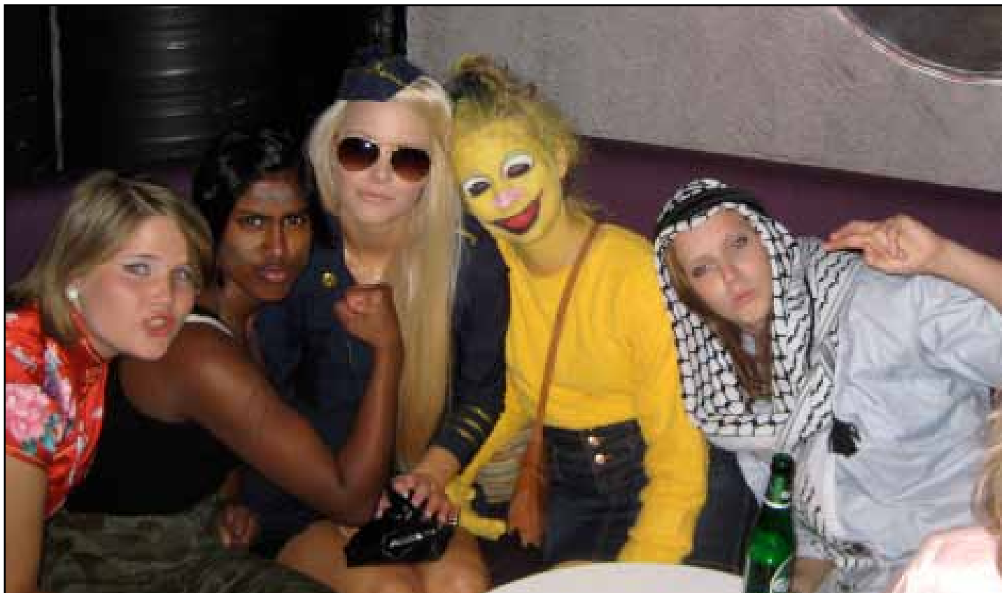
Fine kostymer, men vi foretrekker ”play naked”.