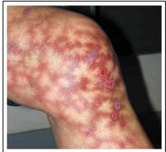
"Erythema ab igne". Vi vurderer å kutte ned på Playstation-spillingen.