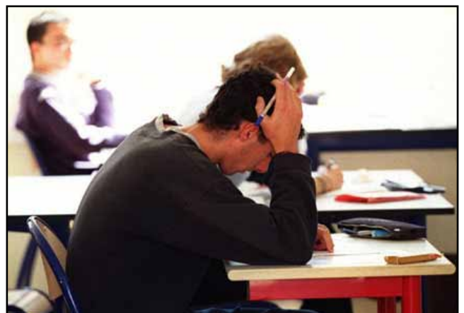
Avbildet: Den beste kur mot både Playstation-tommel og nintendinitis.