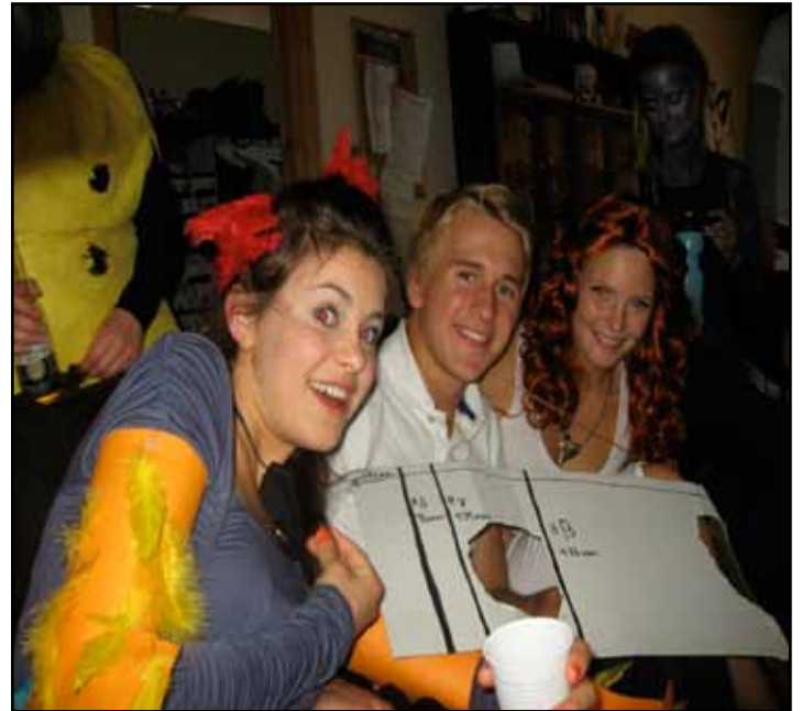
A-fest (nei, vi skjønner heller ikke hva de skal forestille).