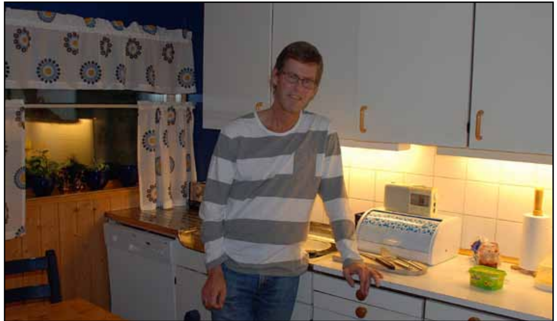
Torp påstår at han ikke er noen kjøkkenmann, men serverer likevel boller og kaffe.

Vi vrir temaet inn på eksamen, men klarer ikke å finne ut noe om de kom-