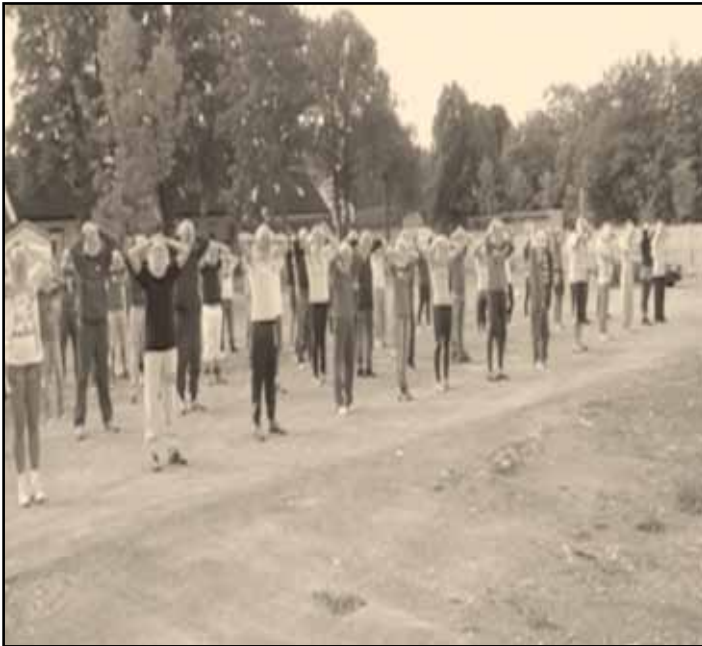
Hvor er de halvnakne jentene blitt av?