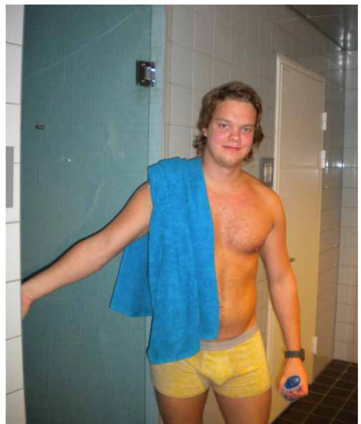
Ute av dusjen - på vei til forelesning

– Ja, det er definitivt plass til én til på LG13, avslutter gromgutten med et smil.