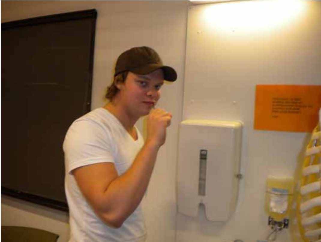
Personlig interiør med skejlett på badet

“Hvis ikke forsøksbenken står på samme sted, er det litt trist.