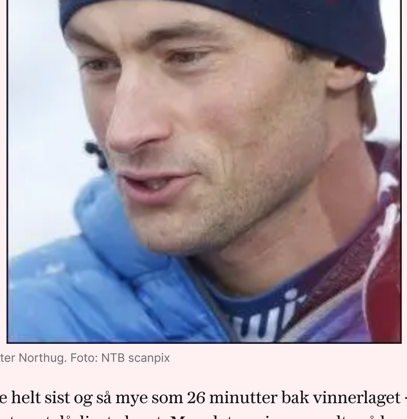
LIKTE DET: Petter Northug.

- Det begynte som en dårlig idé, som vi bygde videre på. Grunnlaget er jo at dette er festdraktene til NTNUI.