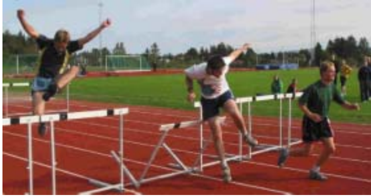
Elegante skiløpere på ti-kampen Erik ikke var på

Hvor lavt går det an å hoppe med en stav på slep.