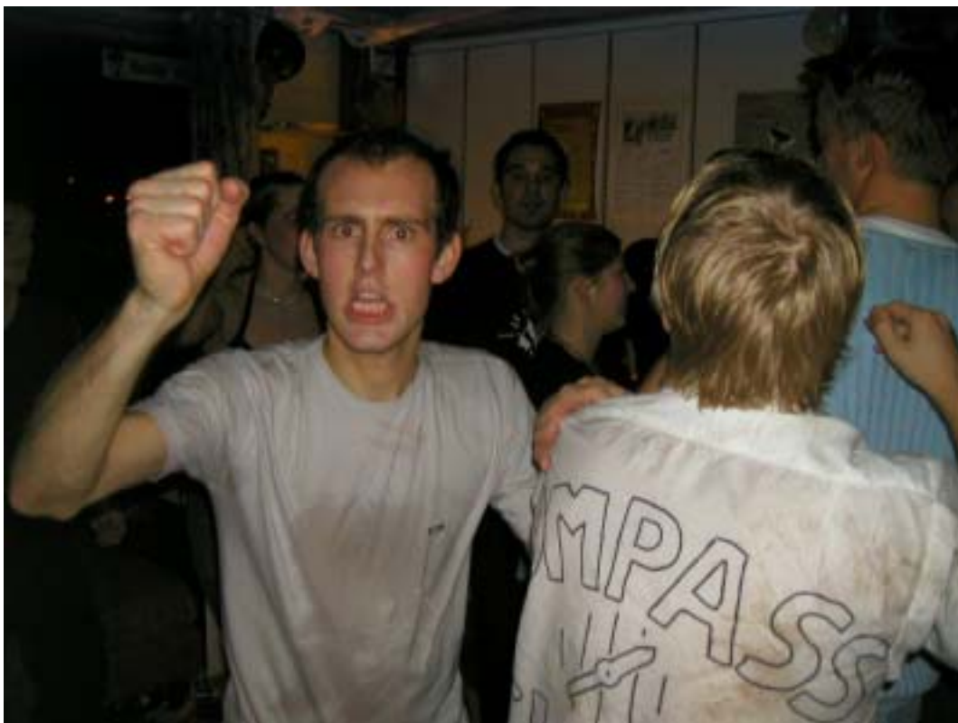
Vår tidligere leder, slik vi gjerne husker han