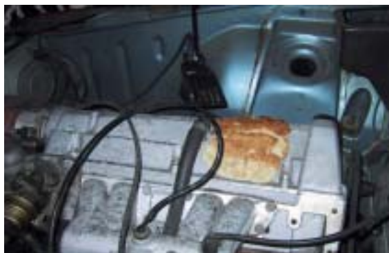
Testpanelet i full gang med SAAB-vaffer

SAAB 900 GL, 83modell: Etter en liten rask biltur med høytt turtall. Var testens neste redskap varm nok til kokkelering. Løse blei fornikti helt over motorklappa. Stekte et tynt lag først og seinere flere lag oppå der igjen. Peraltate var slett ikke varst. De var reist under pannen, noe som var litt innfulgt via Torbjørns ikke fikk de opp på de første fire ferdige. Alle blei å letta da vaffelen smakte hønn bra!