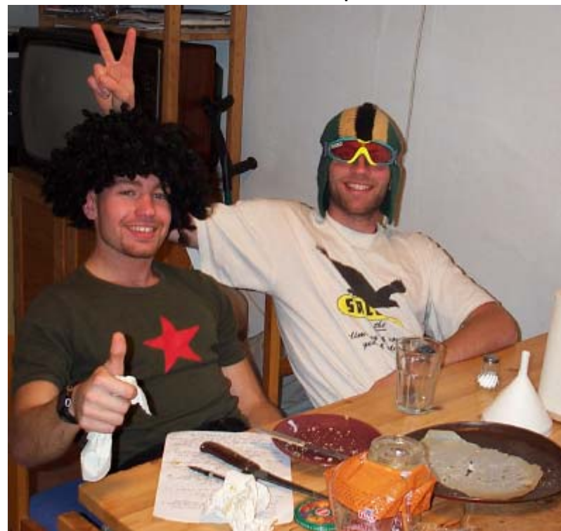
Fbs testpersonell korrekt kledd for anledningen

Smak: Luktet røyk, smaker røyk, ser ut som om den har røyka sjøl. Dager ikke engang som forandring. Hvordan denne greide å lure seg inn i boksen er en gåte.