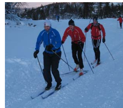
Kanskje får vi et rent Hallberglag i stafetten i år?