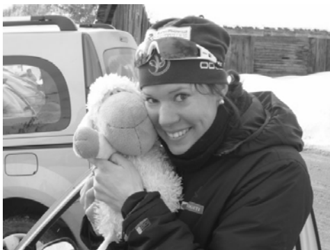
Kan denne jenta og lykkesauen hennes gjøre underverker på jentestafetten?