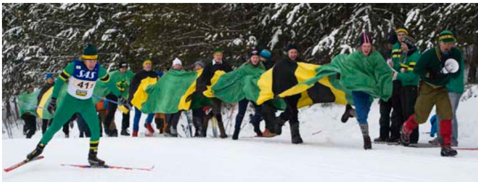
Kanskje får vi et gjensyn med denne heilagjengen under VM? Løperen i bildet må i alle fall nøye seg med å være en av dem under disse konkurransene.

Er det ikke for sent å melde seg på enda, har du fortsatt muligheten til å gjøre det ;-)