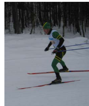
Er denne mannen god nok for ankeretappen i år?

Mesterskapet avsluttes som vanlig med den aller største begivenheten, nemlig stafetten! I skrivende stund er antall lag og lagoppsett enda uvisst, men at NTNUI stiller med mange lag skal det ikke være tvil om. De store spørsmålene er om guttene klarer å toppe den rekordgode 28.-plassen fra fjorårets NM-stafett, og om fransk hjelp kan gjøre at jentene kommer seg ende høyere opp på resultatlista i år enn i fjor.