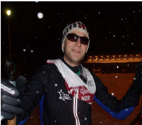
Noen er kulere enn andre..