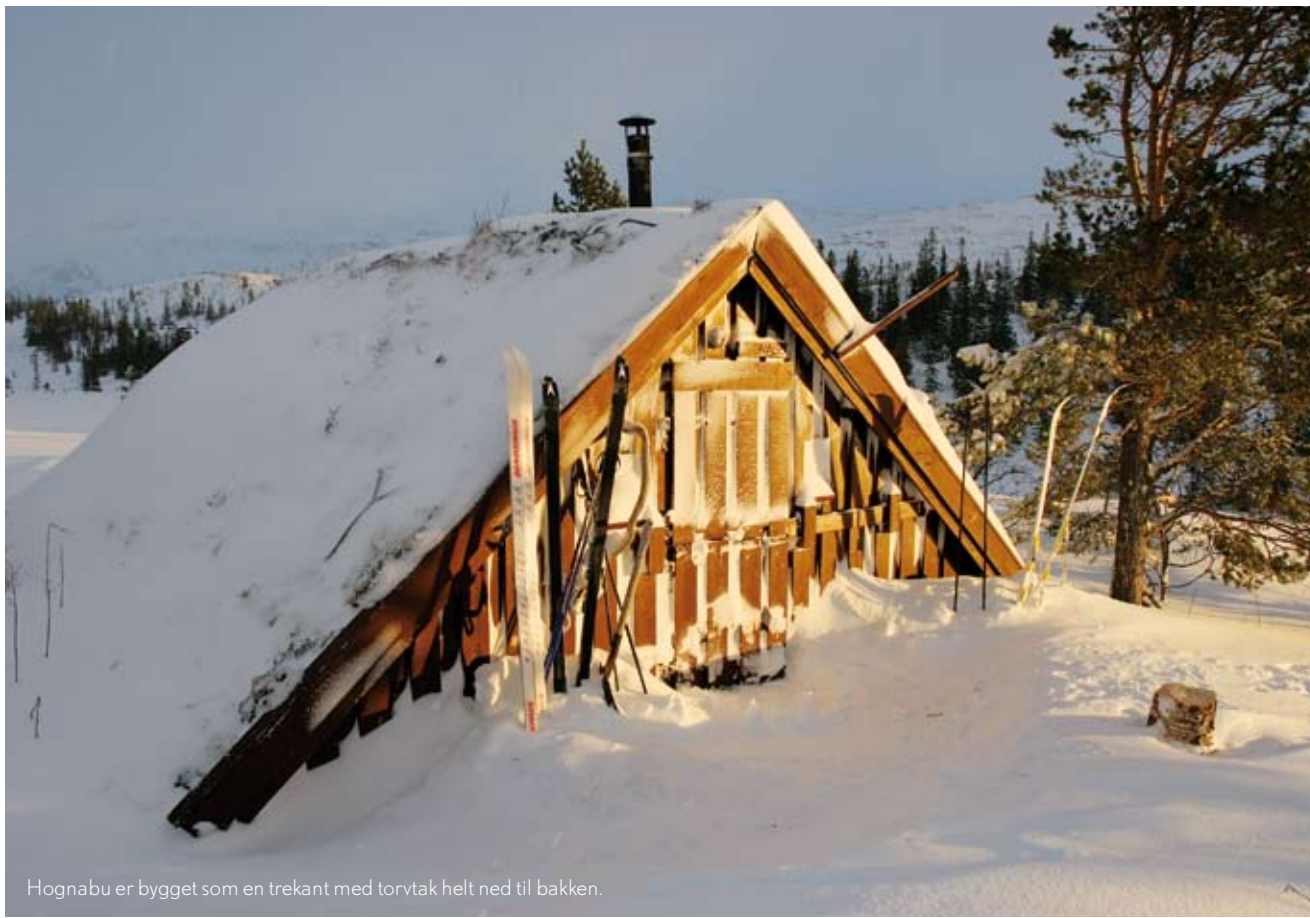
Hognabu er bygget som en trekant med torvtak helt ned til bakken.