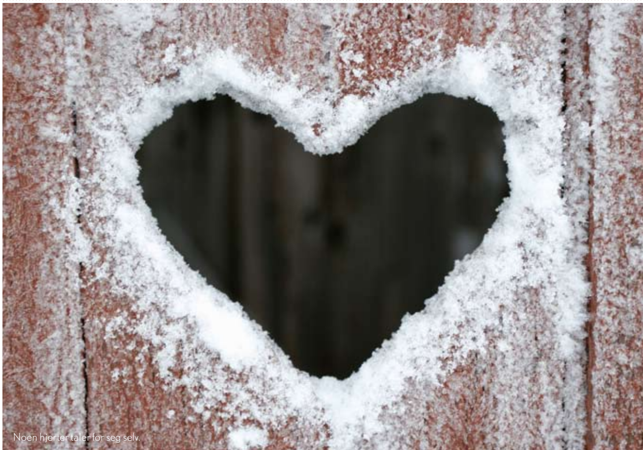
Noen hjerter taler for seg selv.