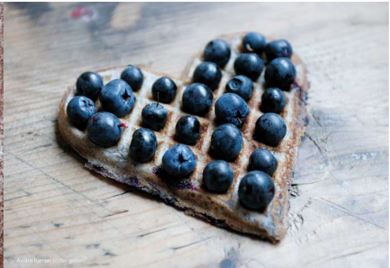
Andre hjerter frister ganen.