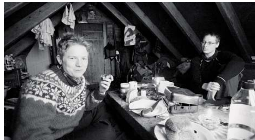
Bilde t.v. Hognabu ligger fredelig med fjelltoppene Ruten og Fongen rett utenfor døra.

Etter hvert har det blitt vanlig at en fikser det ene eller det andre på en vanlig koietur. Å være medansvarlig i drift og vedlikehold av NTNUI-koiennettet gir også en viss stolthet til å være del av et så pass unikt og enestående tilbud for studenter. Men selv om det er mange andre koier en skal holde oversikt over, så har det nok vært Hognabu jeg har hatt mest fokus på de siste årene. Og at det ikke er lenge igjen til neste turen ut til Tydalen og opp til Hognabu er uten tvil.