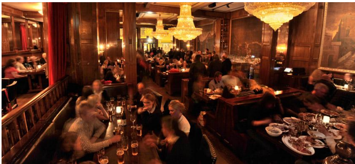
Olympen/Lompa ligger i Grønlandsreiret 15:

Olympen blir kalt både Østkantens Grand og Grønlands storstue. De gamle, ærverdige lokalene i første etasje serveres norsk tradisjonsmat, og menyen skiftes mange ganger i året for å kunne bruke sesongbaserte råvarer. Miljøringen har brukt dette som samlingssted flere ganger etter årsmøter og temamøter. Alltid like hyggelig!