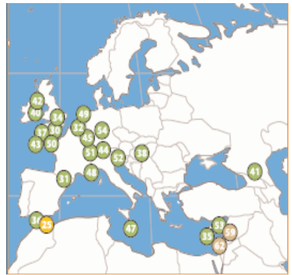
HVOR LENGE VAR JOHN FREDRIKSEN I PARADIS?: Over ser du Tax Justice Networks kart over skatteparadis i Europa. Les hele rapporten på Attacs ressurside. (Ill.: TJN)

En annen interessant utvikling har skjedd i EU-parlamentet. Parlamentet avviste nylig et forslag til nytt regnskapssystem utviklet av de store revisorselskapene, og vil ha inn country by country reporting i såkalte "extractive industries" - dvs. gruvevirksomhet, olje, gass etc. - virksomhet som tar ut